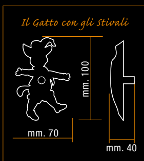
Il Gatto con gli stivali