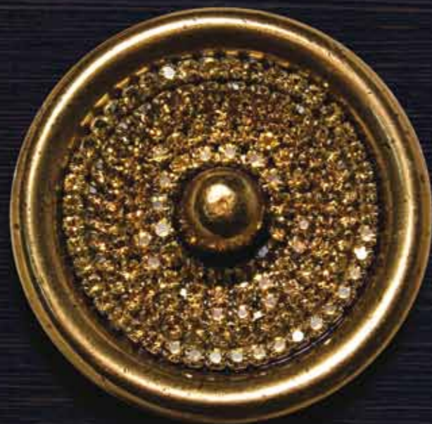
Oro Antico - FINITURA 11 con Brillanti Ambra Antique Gold - FINISHING 11 with Amber Crystals