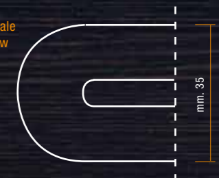
_vista frontale _frontal view