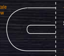
_vista frontale _frontal view