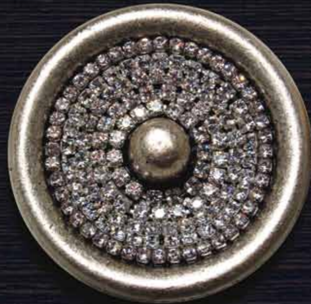
Argento Antico - FINITURA 09 con Brillanti Cristallo Antique Silver - FINISHING 09 with Crystals